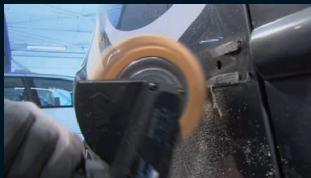
Entfernung von Klebstoffresten

Der Vinyl Zapper® wird mit einem MONTI Aufnahmesystem 23 mm auf den Antriebsaggregaten MBX® Pneumatic oder MBX® Electric verwendet.