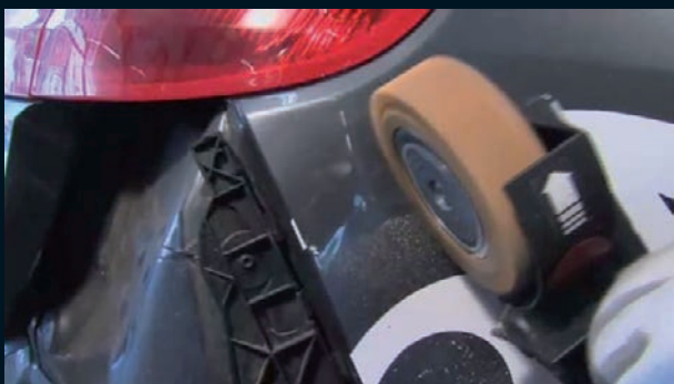
Entfernung von Fahrzeugbeschriftungen

Durch den beim Arbeiten entstehenden Luftkisseneffekt ist ein vibrationsfreier und ruhiger Lauf des Vinyl Zapper® stets gewährleistet.