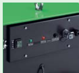
Schalt- und Bedienungs- tableau bedienerfreundlich und geschützt angeordnet