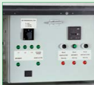
Schaltkasten mit Betriebsstundenzähler, geschützt eingebaut