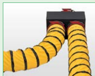
Betrieb mit Vorsatzstück und Warmluftschläuchen ELT 18-S