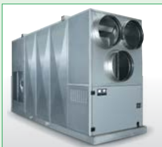
REMKO HTL 400