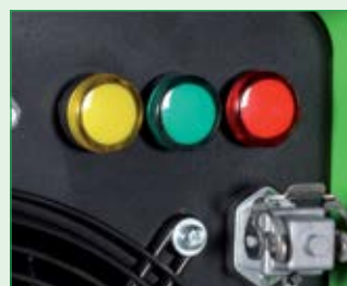
Anzeigeleuchten für Betriebszustände