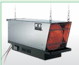
REMKO PGT 100 Ausführung INOX (Montagebeispiel)