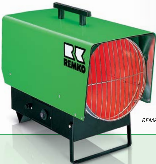
REMKO PGT 60