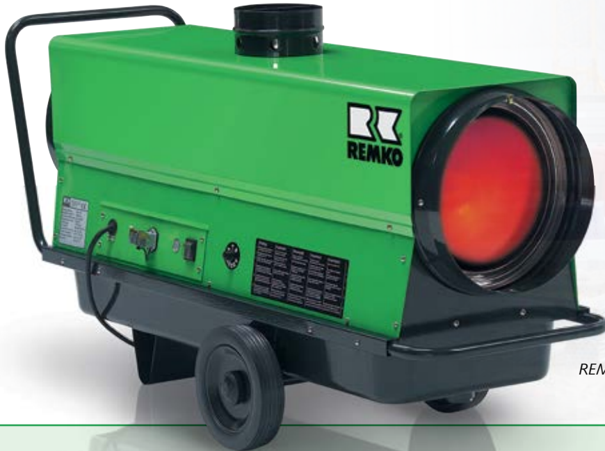
REMKO ATK 25