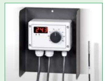
Elektronischer Feuchtraum- thermostat, Typ ETR-5