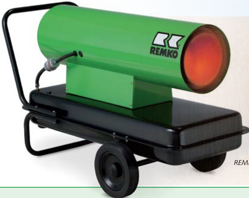
REMKO DZH 30-2