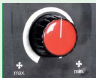
Individuelle Wärme- regulierung