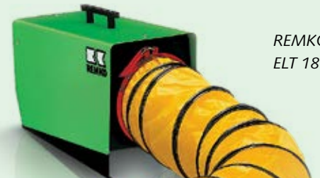
REMKO ELT 18-S