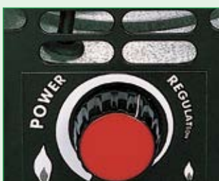
Eingebaute Power-Regulation für stufenlose Leistungsregelung