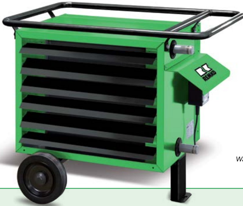
Warmwasser-Heizautomat REMKO PWB

Heizen und Trocknen ohne Baustopp durch den Winter