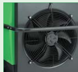
Leistungsstarke, geräuschoptimierte Sichel-Ventilatoren