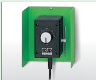
Feuchtraumthermostat EDV-Nr. 1011250