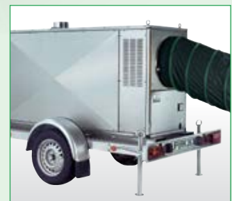
Die Heizzentrale mit Anhänger zugelassen für Straßenbetrieb