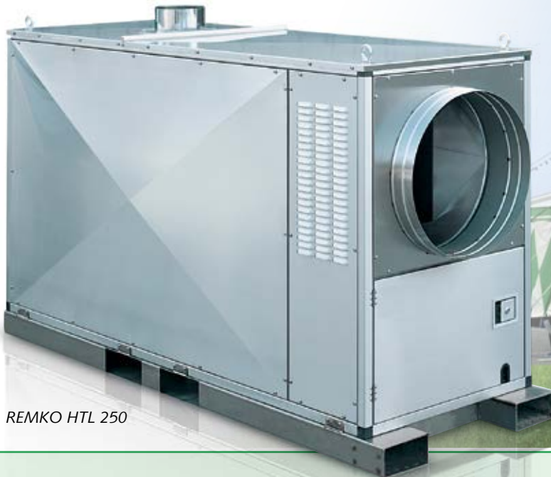
REMKO HTL 250

Serie HTL serienmäßig in Edelstahl-Ausführung, unübertroffen in Qualität und Leistung