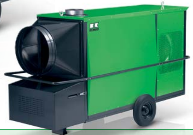
REMKO CLK 80-RV

CLK 80/170-RV max. Pressung von 410/520 Pa