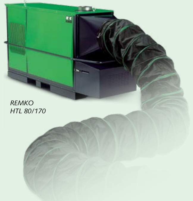
REMKO HTL 80/170