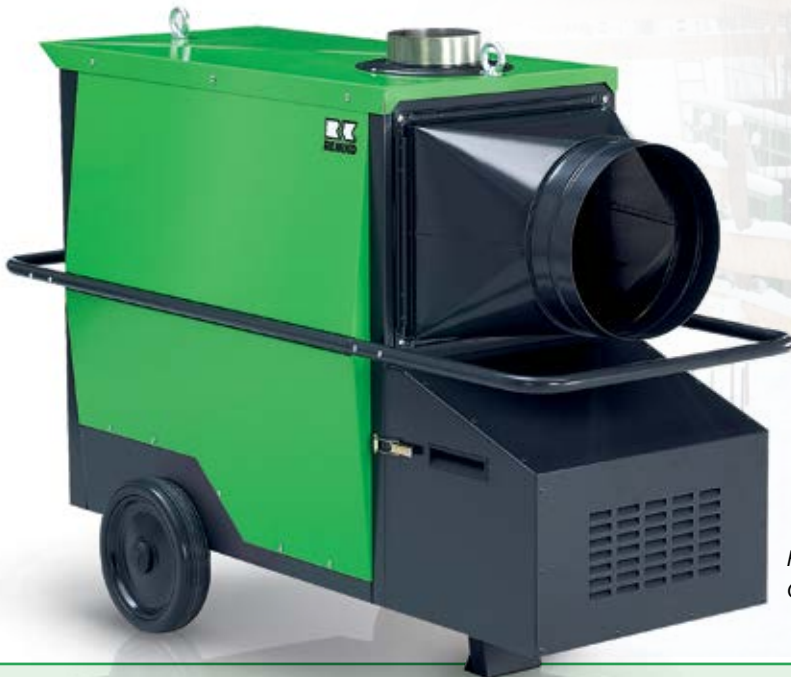
REMKO CLK 50