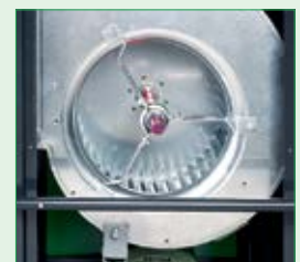
CLK 80-RV und 170-RV serienmäßig mit Radial- Ventilator