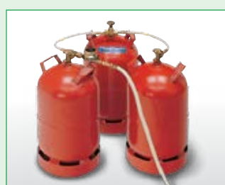
Mehrflaschen-Set EDV-Nr. 1014050