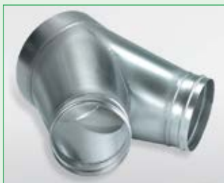
Multifunktions-Luftverteiler- kopf EDV-Nr. 1009560