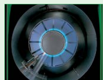
Effektive Verbrennung durch die Multi-Point-Injection