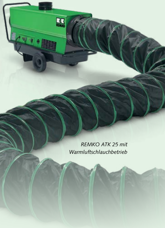
REMKO ATK 25 mit Warmluftschlauchbetrieb