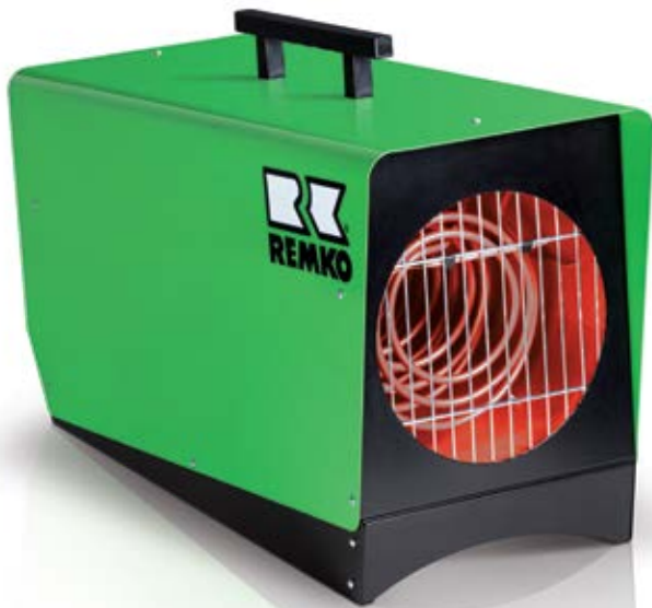
REMKO ELT 10-6