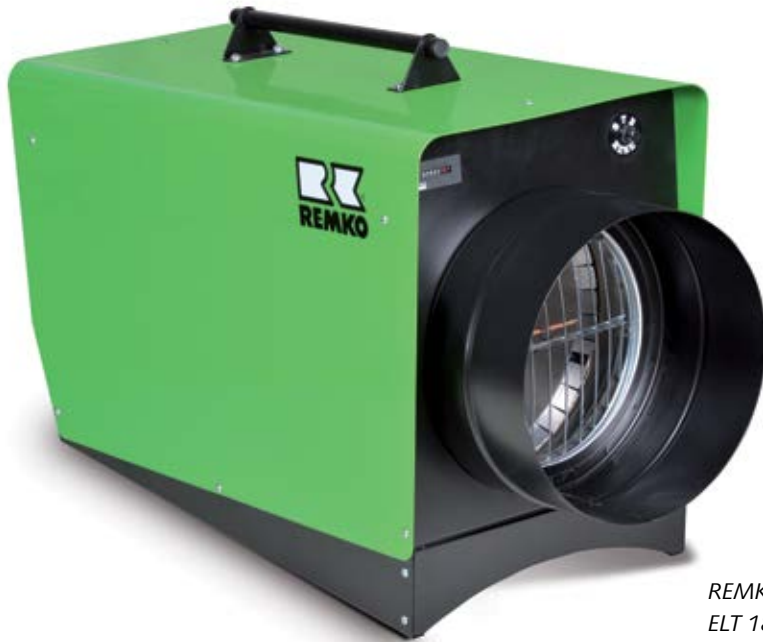
REMKO ELT 18-HT