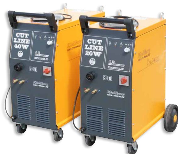
Die CUTLINE-Reihe mit flüssigkeitsgekühlten Plasmabrennern ist vor allem bei häufigem und regelmäßigem Einsatz zu empfehlen.