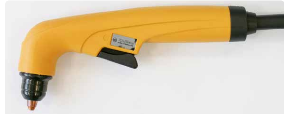
Ergonomisch geformter Plasma-Handbrenner KjellCut

Dank der ergonomisch geformten Griffe und dem geringen Gewicht der KjellCut-Plasma-brenner geht das Arbeiten einfach von der Hand. Neben der komfortablen Bedienung steht hierbei auch die Sicherheit im Vordergrund. Ein Einschaltenschutz verhindert das ungewollte Zünden des Plasmabogens.