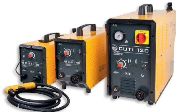
Die CUTi-Reihe steht für Mobilität in der Anwendung.

Der Inverter CUTi 35 erzielt durch die sinusförmige Stromaufnahme mit PFC (Power Factor Correction) seine maximale Leistung aus dem einphasigen 230 V-Netz.